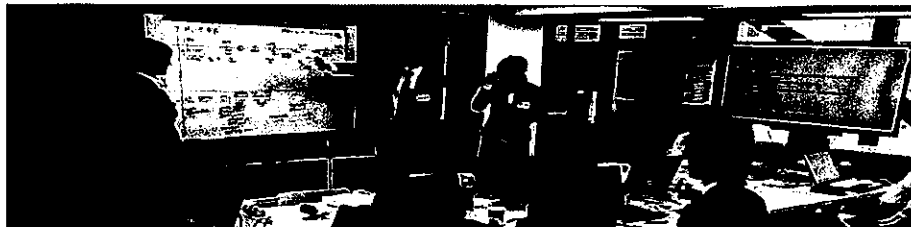
真の課題解決にチャレンジ (社内のディスカッションの様子)